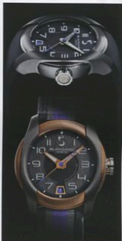
Uniformity, le premier modèle de la marque Blacksand. Il en contient les codes et l'ADN.