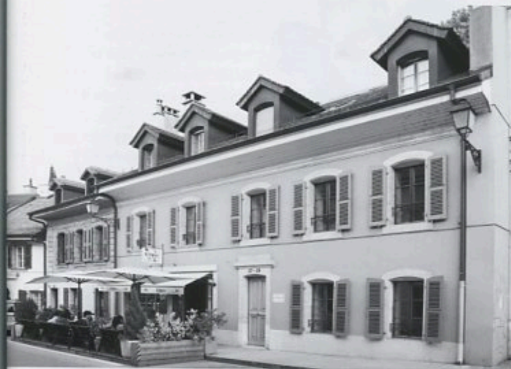
Blacksand s'inscrit dans le long terme: acquisition de 200 m 2 . Une fabrique horlogère est née à Carouge.

chantre de l'horlogerie loyale et réaliste, avec son modèle Uniformity, un rêve de simplicité aboutie, puriste, absolue. L'une des expressions les plus matures d'un Swiss Made vrai et jusqu'au-boutiste. Une montre, tout simplement. Une trois aiguilles, bourrée d'attentions horlogères et de subtilités, conjuguées sur le mode du semper fidelis , maxime incarnant sa soif d'authentique. Peu à peu, au fil d'un