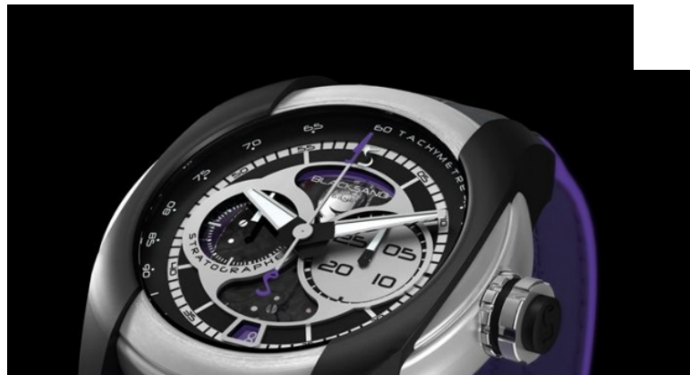
Le Stratographe de Blacksand

La jeune marque créée en 2011 présente un chronographe mono-poussoir baptisé Stratographe. Une montre qui marque les esprits et qui mérite le respect.